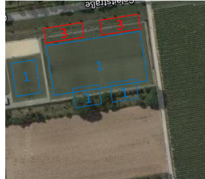
Zone 1: Spieler + Verantwortliche Zone 3: Zuschauer (10 Pers.-Segmente)