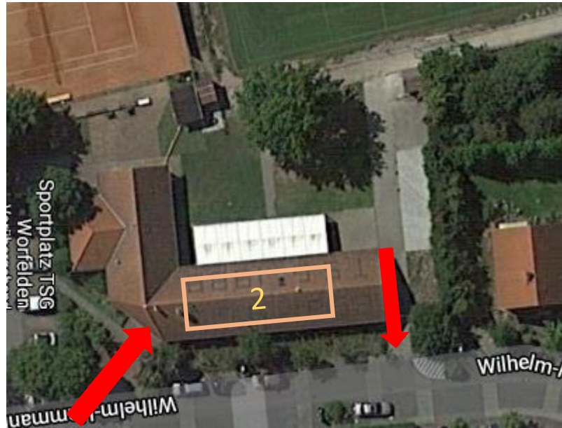
Zone 2: Umkleide Ein- und Ausgang und WC nur für Spieler